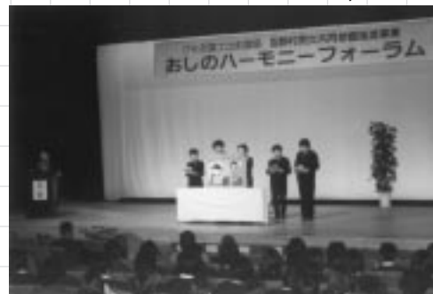
やまなし男と女ネットワークによる大型紙芝居