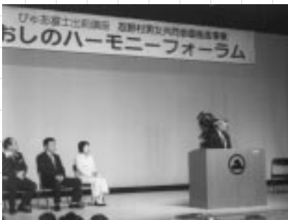
開会セレモニーの様子

忍野村の男女共同参画事業に関するご意見、ご質問は 忍野村 総務課 男女共同参画事業担当 TEL 05555・84・3111(代)