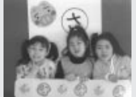
準優勝 ミニモニチーム