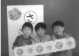
第3位 ゴールド・キングチーム