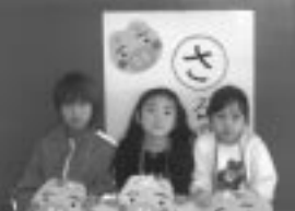
優勝 ゆきだるまチーム

1月9日に行われた大型かるた大会は、参加17チームにより、熱戦が繰り広げられました。当日の参加チームや対戦の様子が館内に写真で掲示してあります。