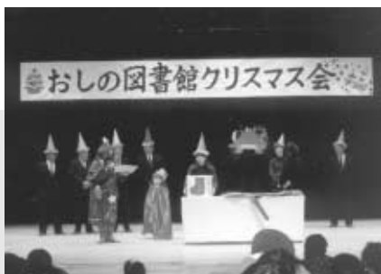
クリスマス会おたのしみ抽選