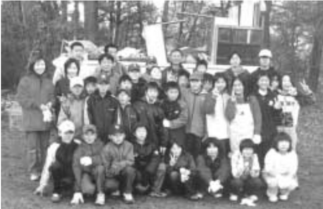
ボランティアの方々です。

当日は、小学生・教員・一般ボランティアの方々約40名の参加があり、不法投棄ゴミを撤去しました。ご協力ありがとうございました。