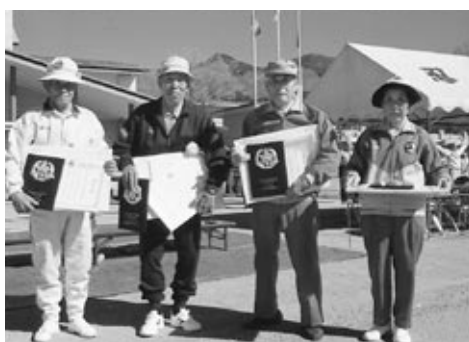
体育功労賞受賞者