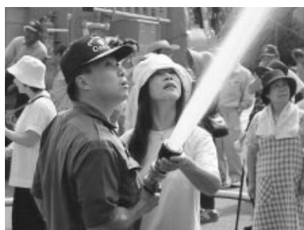
初期消火訓練の様です。