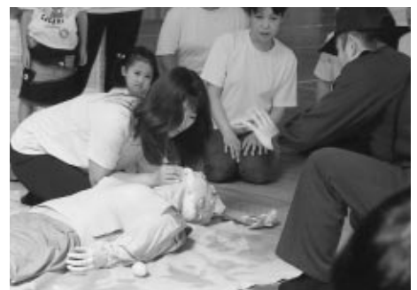
救命救急訓練の様です。