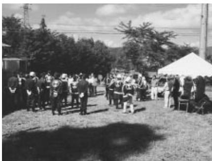
事前避難誘導訓練の様です。