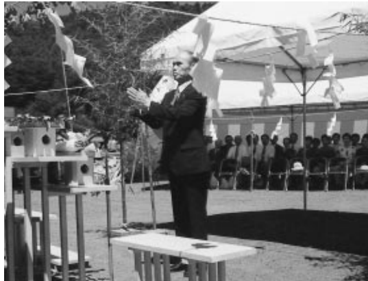
湧池会場で忍野八海の守護神をまつる神事が厳かに行われました。