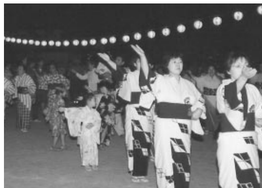
忍野中学校校庭で納涼大会があり、盆踊りや八文字焼き、花火大会等が盛大に行われました。