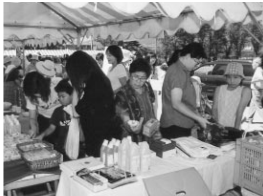
忍野小学校校庭で朝市が行われ、新鮮な農産物、海産物等が販売され、多くの人が集まりました。